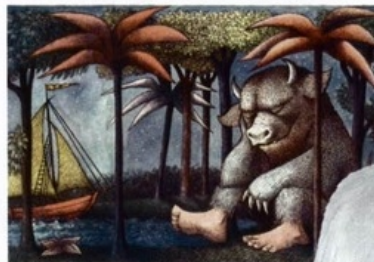
STORY AND PICTURES BY MAURICE SENDAK