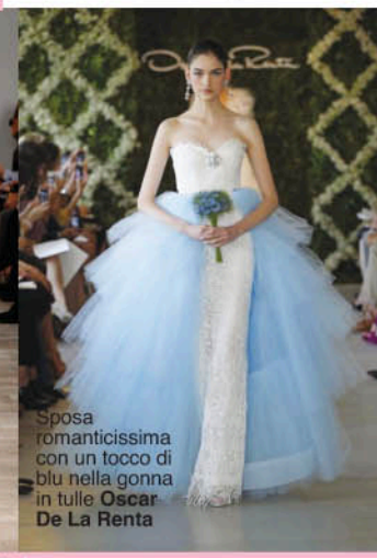
Sposa romanticissima con un tocco di blu nella gonna in tulle Oscar De La Renta