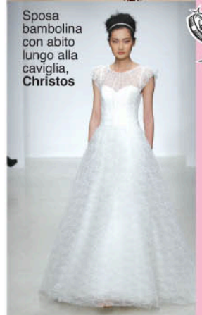
Sposa bambolina con abito lungo alla caviglia, Christos